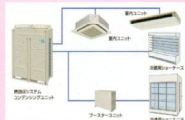
冷蔵・冷凍・空調 一体型システム