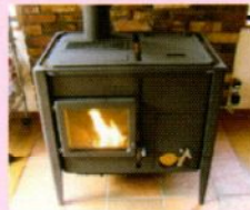
バイオマス燃料 燃焼機器